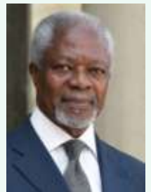
Γ. Γ. ΟΗΕ Κόφι Ανάν (1938 - )

Αν οι ελπίδες μας να χτίσουμε ένα καλύτερο και ασφαλέστερο κόσμο για όλους πρόκειται να γίνουν πραγματικότητα και όχι να μείνουν ευσεβείς πόθοι, θα χρειαστούμε την απασχόληση των εθελοντών περισσότερο από ποτέ».