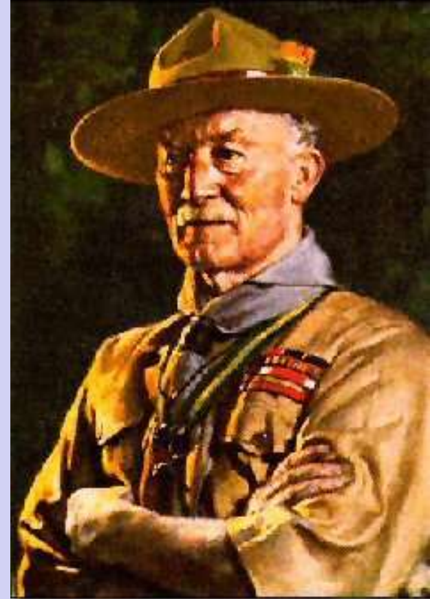
Λόρδος Ρόμπερτ Μπέηντεν Πάουελ (1857-1941)

30 εκατομμύρια μέλη 217 χώρες και περιοχές