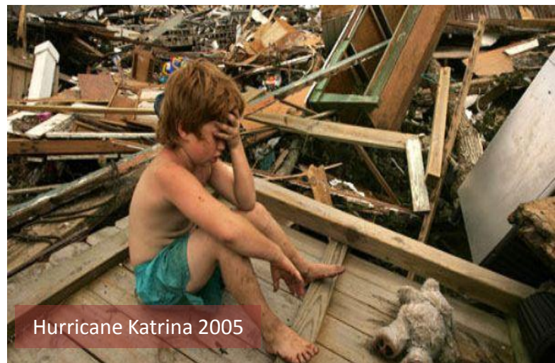
Hurricane Katrina 2005

«Σε όλες τις καταστροφές, είτε αυτές προκύπτουν από τις δυνάμεις της φύσης είτε από ανθρωπογενείς παράγοντες, οι άνθρωποι που εμπλέκονται υποβάλλονται σε σοβαρές καταπονήσεις.... Είναι ζωτικής σημασίας να επισημανθεί σε όλο το προσωπικό που εμπλέκεται στην καταστροφή ότι πρέπει να έχουν μια κάποια εξοικείωση με κοινά πρότυπα αντιδράσεων σε ασυνήθιστες καταστάσεις συναισθηματικού στρες και έντασης και πρέπει επίσης να γνωρίζουν τις θεμελιώδεις αρχές της αντιμετώπισης ...» (Αμερικανική Ψυχιατρική Εταιρία, 1954)